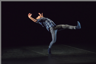
I'M NOT A KID ANYMORE