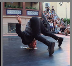
DON LIMPIO