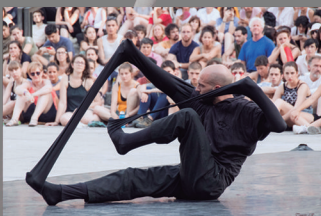
SIN MIEDOS

10 da mañá. Esta vez ninguén vai chamar á porta. Palabras que compoñen os recordos dunha nena sobre a reacción da súa nai. Para nós, o detonante dun delirio que pon á luz a pegada que nos deixan as nosas vivencias.