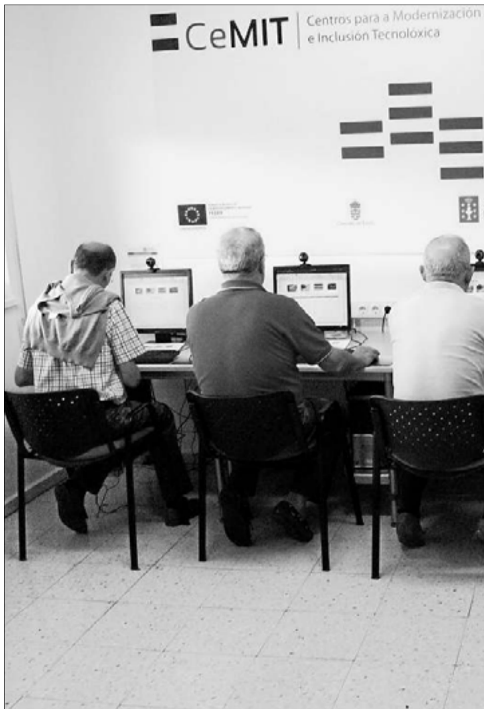
Unha das aulas formativas promovidas pola Xunta dentro da Rede CeMit.

• Formación básica: uso das novas tecnoloxías nos