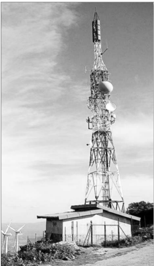
Antena de emisión.