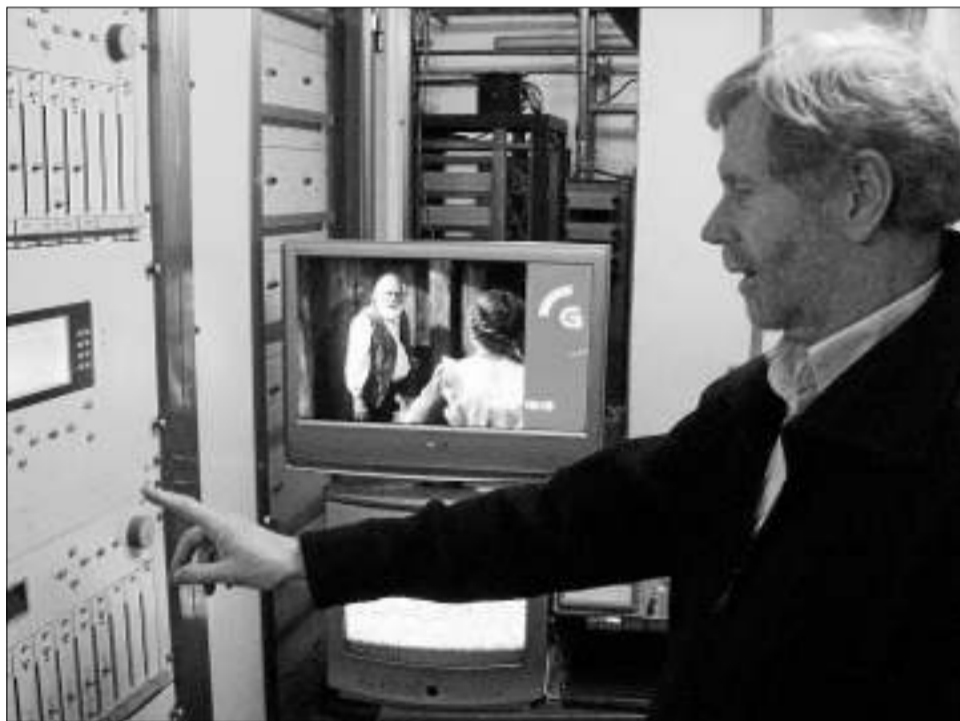
O centro emisor de Domaio, en Moaña, cando se produxo o apagón analóxico.