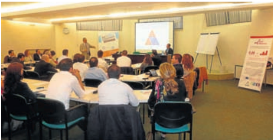
Imagen de uno de los encuentros de la red de mentores.

La Red Mentoring cuenta en la actualidad con 88 mentores que apoyaron o están asesorando de forma gratuita a las 84 empresas