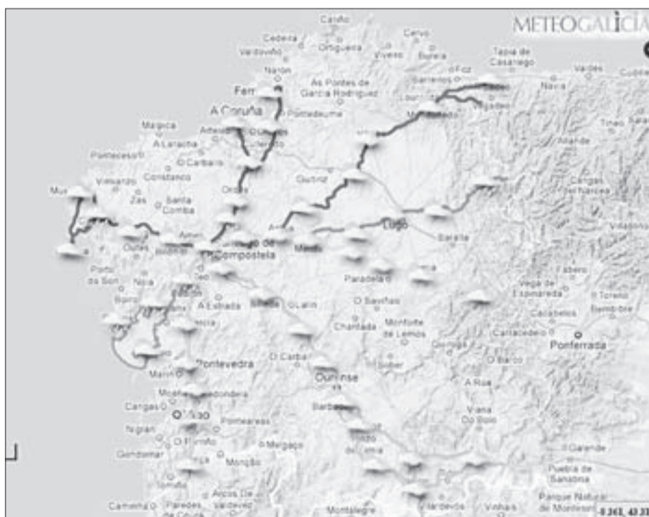
A web ofrece en tempo real o tempo nas distintas rutas xacobeas a Santiago.

Ó longo deste período MeteGalicia ten acadadas cotas sobresaíntes na observación da atmosfera, mediante a rede de estacións meteorolóxicas, hoxe en proceso de certificarse mediante unha ISO9001, a primeira de España; mediante a rede de boias oceanográficas