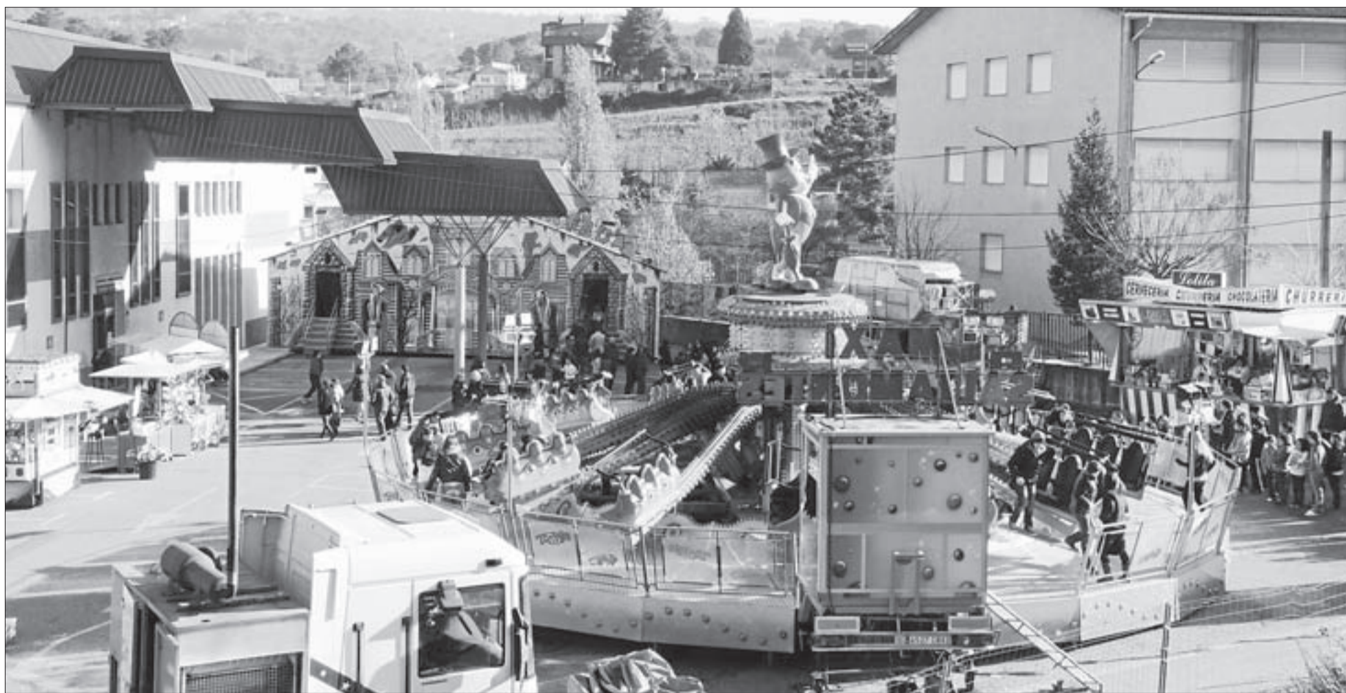
El Saltamontes, instalado en la zona exterior del Pazo dos Deportes Paco Paz, es una de las atracciones favoritas de los jóvenes que acuden a Pazolandia.

MAÑANA, DÍA 31, EL RECINTO ESTARÁ CERRADO